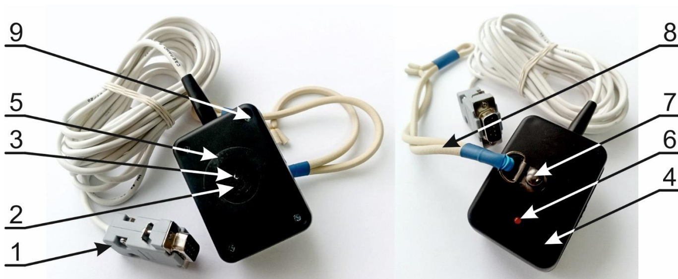
Исполнение П1, П2