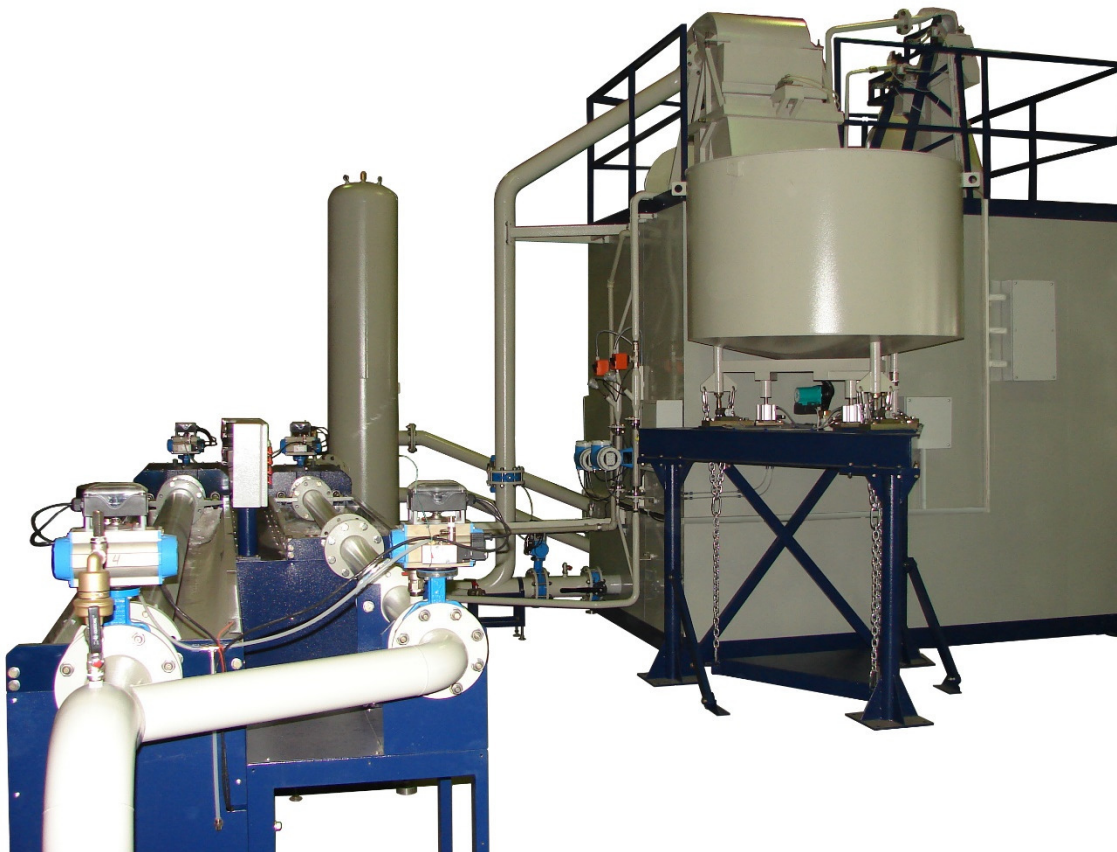
Рисунок 1 – Общий вид установок поверочных УПСЖ-ПРО

Общий вид установок поверочных УПСЖ-ПРО представлен на рисунке 1 и 2.