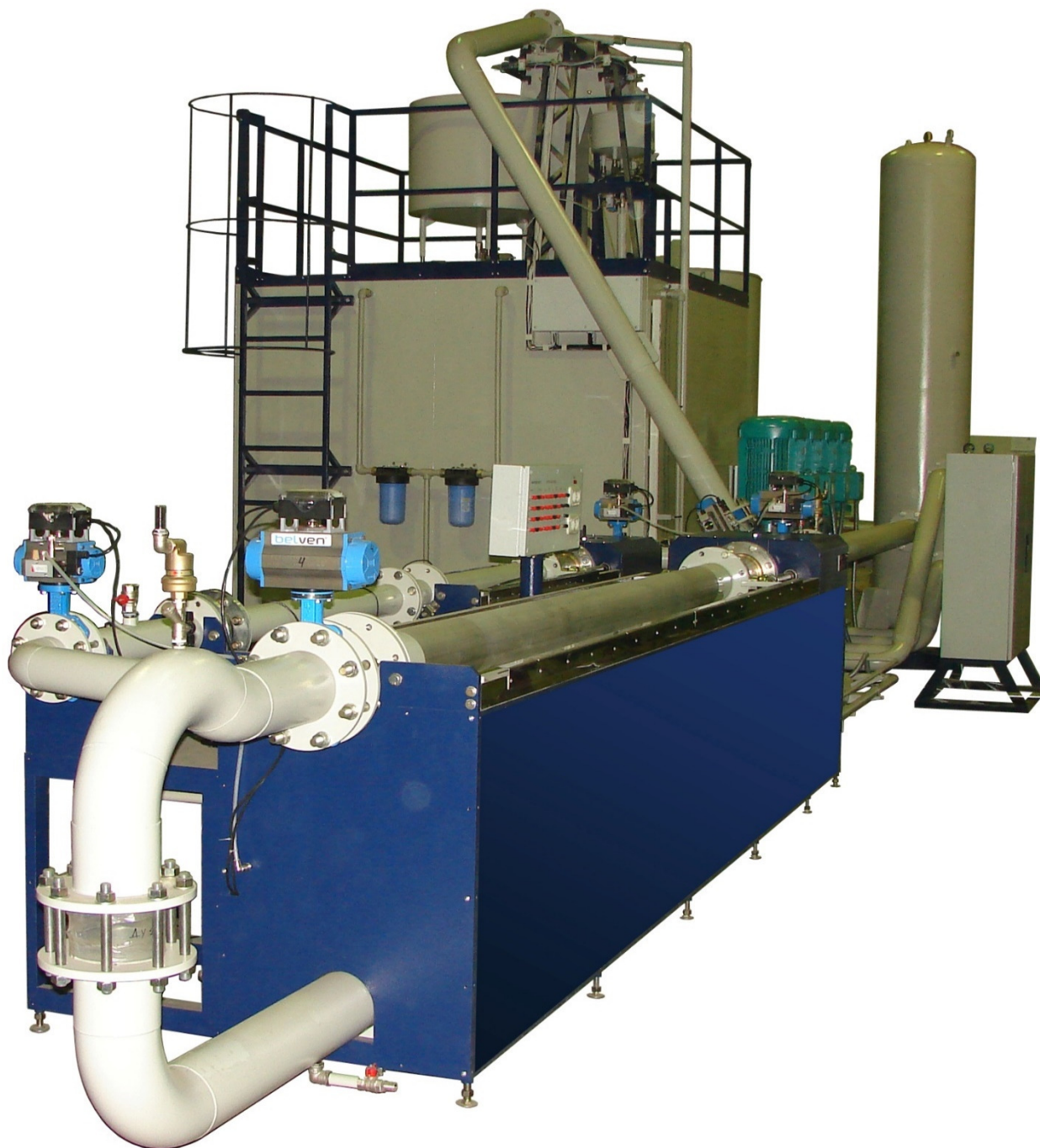
Рисунок 2 – Общий вид установок поверочных УПСЖ-ПРО

Пломбировка установок поверочных УПСЖ-ПРО осуществляется с помощью свинцовой (пластмассовой) пломбы и проволоки, которой пломбуются фланцевые соединения расходомеров установки, с нанесением знака поверки на пломбу и с помощью наклейки, которая клеится на оптодатчики (при их наличии) положения перегородки устройств переключения потока, с нанесением знака поверки на наклейку. Средства измерений условий окружающей и измеряемой среды пломбируются в соответствии с описанием типа на конкретное средство измерений. Места нанесения знака поверки на фланцевые соединения расходомеров и на оптодатчики положения перегородки устройств переключения потока (при их наличии) установок поверочных УПСЖ-ПРО приведены на рисунке 3.